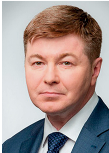
ником, желаю вам новых трудовых достижений, здоровья и благополучия!

Хочу поблагодарить всех авторов оптимизационных решений за полезную работу, проделанную ими в кризисный период. Все сотрудники «Русснефти» оказались в это непростое время на высоте. Поздравляю вас, уважаемые коллеги, с профессиональным празд-