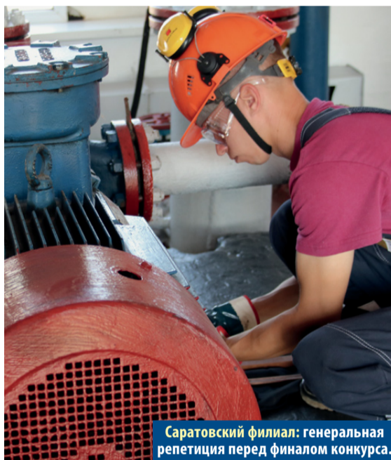
Саратовский филиал: генеральная репетиция перед финалом конкурса.

Каждое соревнование должно преподнести сюрпризы, на мой взгляд. Это доказывает, что борьба была честной. Мы в первую очередь обращаем внимание на безопасность работ, отсутствие нарушений, правильность выполнения заданий.