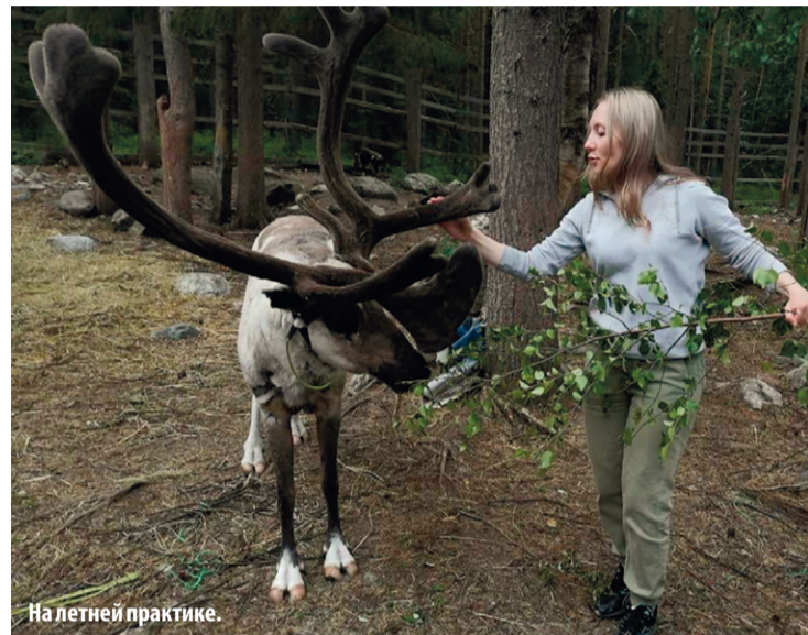
На летней практике.

«Я родилась в Томске, живу в Новосибирске, работаю в Тюмени, а учусь на очном отделении в Москве. Вот как бывает! В 2010 году я окончила Томский государственный университет по направлению «Геология». Затем трудилась в Новосибирске, в научно-исследовательском институте. Начинала с описания керн и шлифов терригенных, сульфатных и карбонатных пород. Набравшись опыта, стала заниматься построением детальных литолого-минералогических разрезов, схем корреляции фаций, литолого-фациальных карт, принципиальных схем формирования отложений».